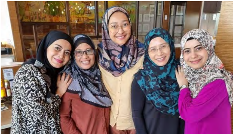
Bergambar dengan upline