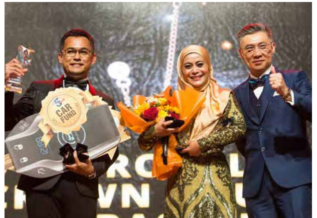
BE Convention 2022