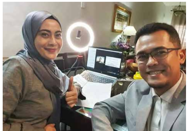
Melakukan perkongsian dalam talian

Pasangan RCCA itu menggesa, “Bersifat cekal untuk mengenali BE International dan biarkan BE membantu anda mendedahkan potensi anda. Jangan mengelak pada permulaan. Ikuti dan anda akan fahaminya. Anda tidak memerlukan seluruh dunia untuk mempercayai anda, hanya beberapa orang atau hanya diri anda sendiri, untuk mempercayai anda untuk membuat perubahan. Lakukan perubahan 1% itu setiap hari dan pada akhirnya, anda akan menjana 365% perubahan dalam setahun.”