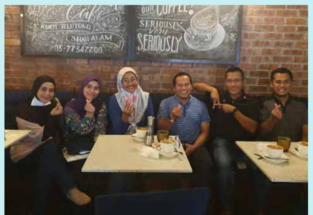
Bergambar dengan upline