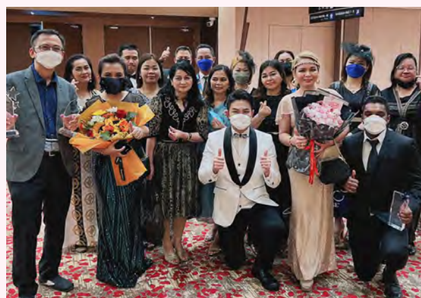
Bergambar bersama upline dan para IBO