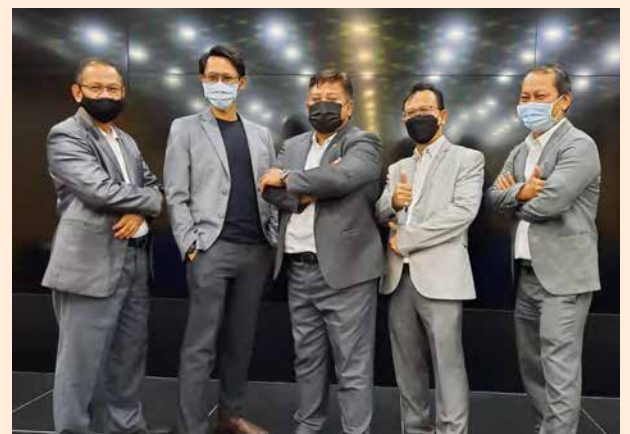
Bergambar bersama upline dan IBO