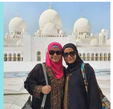
BE Lifestyle Travel ke Dubai

“Menjadi pemimpin yang baik bermakna kita harus menjadi pengikut yang baik. Jangan berhenti belajar, jangan berhenti berubah, jangan berhenti mencabar diri sendiri, keluar dari zon selesa anda dan BERUBAH. Jangan leka, jangan terlalu selesa dengan tempat anda berada kerana hidup senantiasa BERUBAH.”