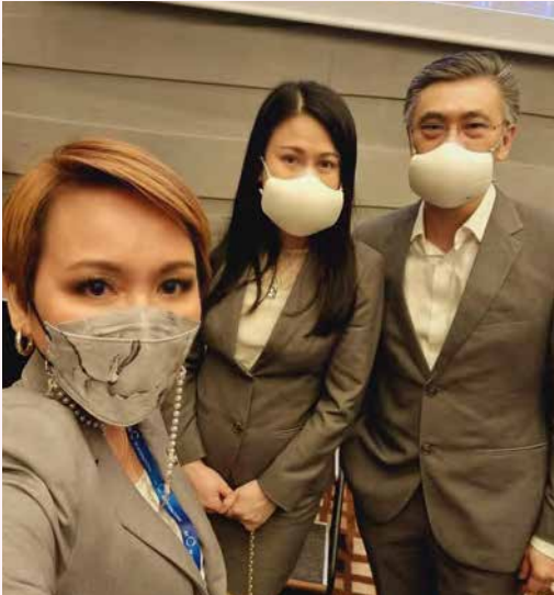
Gambar bersama Founder