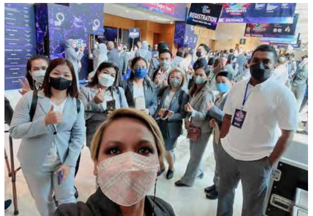
Malam BE Convention