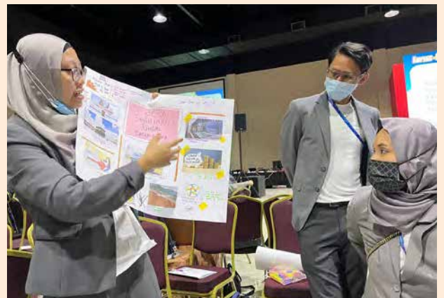
Sesi papan impian