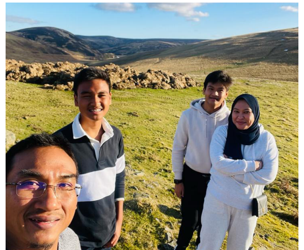
Percutian keluarga di Edinburgh