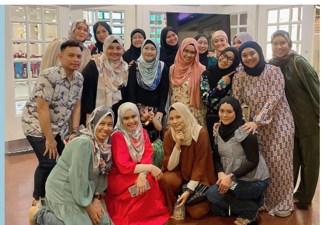
Dengan pasukan saya yang telah bersama saya melalui suka dan duka

“Ingat YOLO – ‘anda hanya hidup sekali’ – jadi dapatkan yang terbaik dalam hidup! KALAU ANDA RASA BOLEH, ANDA BOLEH. Ini ialah moto paling mudah untuk diingati dan penyepak terhebat saya setiap kali saya berasa lemah semangat!” beliau membuat kesimpulan.