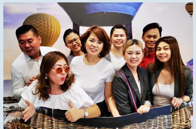
Berjuang bersama untuk melayakkan diri ke BE Lifestyle ke Turki