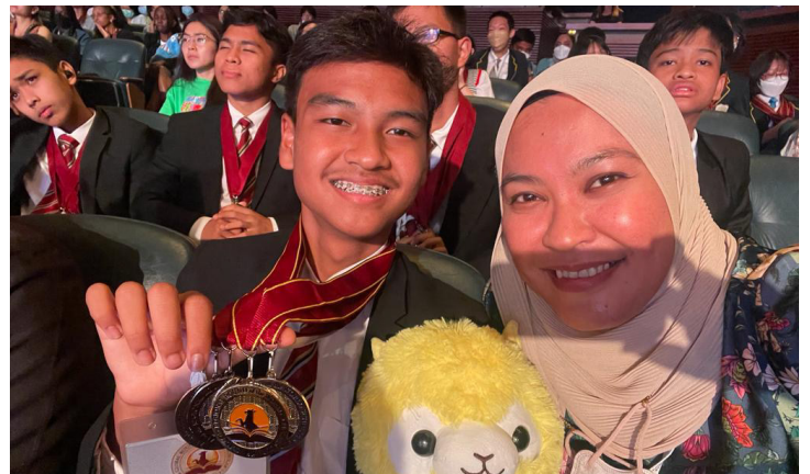
Kecemerlangan sukan juga ada dalam keluarga.