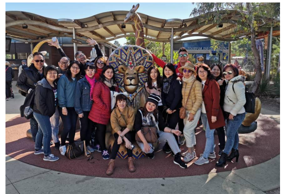
Kempen BE Lifestyle ke Melbourne