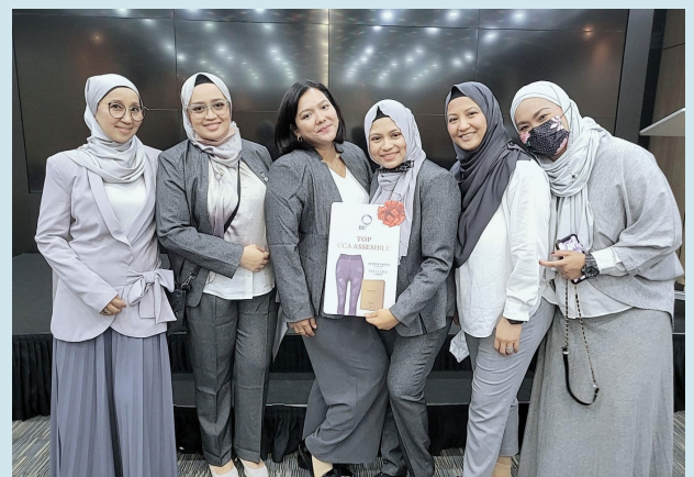
Anugerah untuk Senarai Pencabar saya, Seluar terhad eksklusif