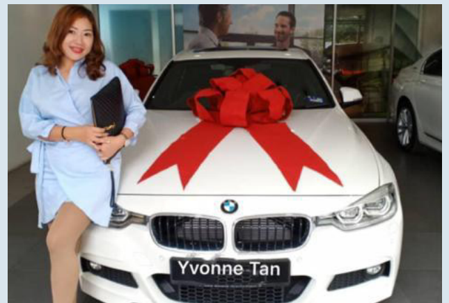
BMW pertama saya