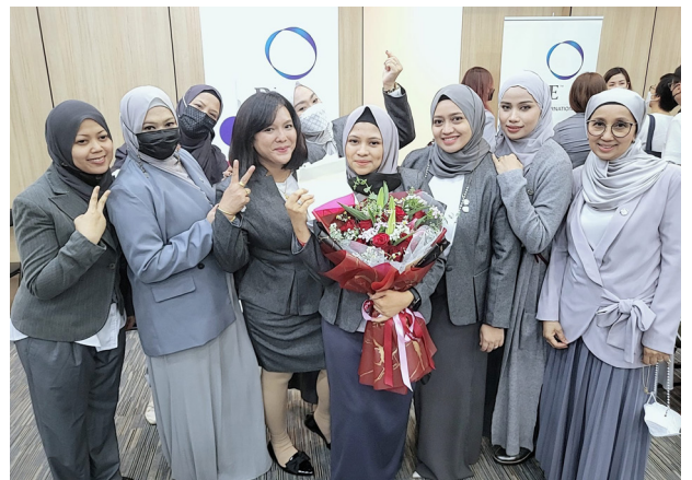
Menerima sejangam bunga besar untuk meraikan detik yang tidak dapat dilupakan pada hari saya menjadi RCCA