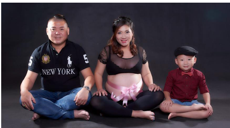
Gambar kenangan yang diambil pada tahun 2018 semasa saya hamil 38 minggu. Anak perempuan saya dilahirkan pada bulan Mei tahun yang sama.