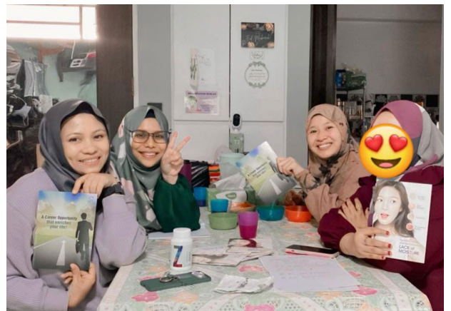
Salah satu kegembiraan terbesar saya, ikatan dengan orang yang tidak dikenali yang kini saya gelar sebagai kawan