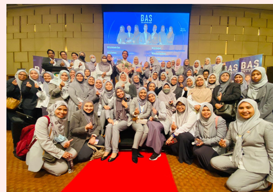
Menghadiri BAS bersama pemimpin utama dalam #BEwithJieRan network