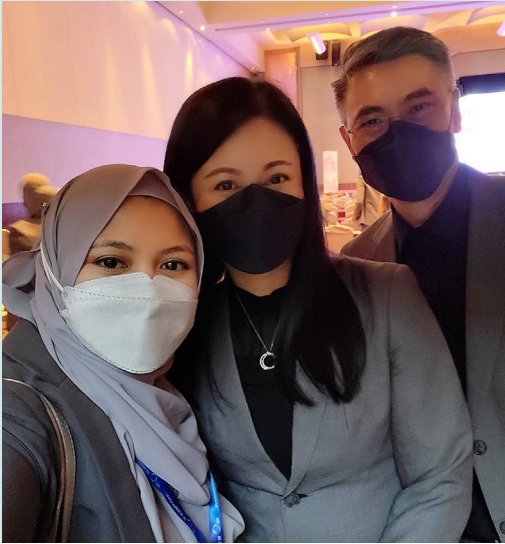
Photo with Founder

membentuk hubungan dalam rangkaian saya dan bukan hanya menganggap orang sebagai kenalan.”