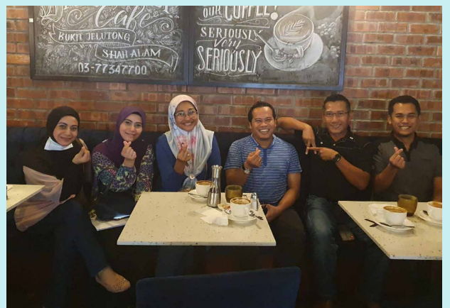
Bergambar dengan upline