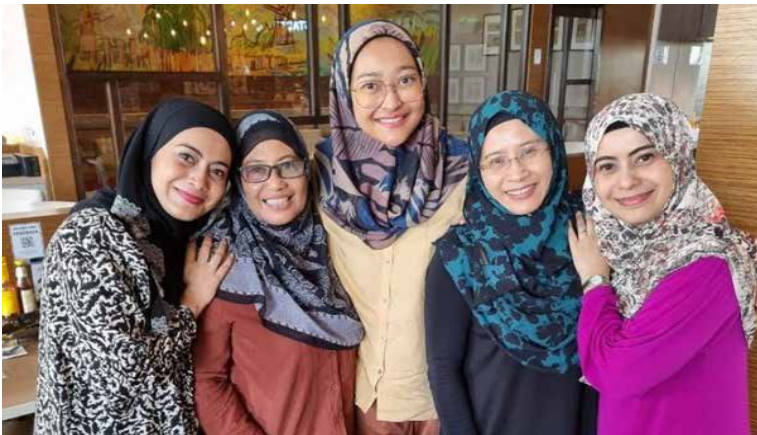
Bergambar dengan upline