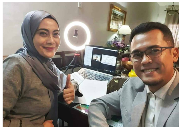
Melakukan perkongsian dalam talian

Pasangan RCCA itu menggesa, “Bersifat cekal untuk mengenali BE International dan biarkan BE membantu anda mendedahkan potensi anda. Jangan mengelak pada permulaan. Ikuti dan anda akan fahaminya. Anda tidak memerlukan seluruh dunia untuk mempercayai anda, hanya beberapa orang atau hanya diri anda sendiri, untuk mempercayai anda untuk membuat perubahan. Lakukan perubahan 1% itu setiap hari dan pada akhirnya, anda akan menjana 365% perubahan dalam setahun.”