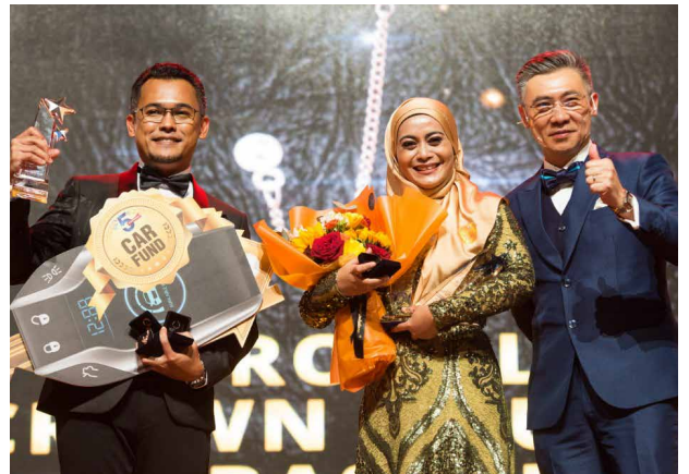
BE Convention 2022